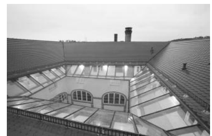
Der gläserne Laubengang heute