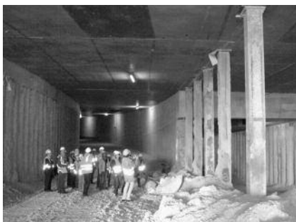
Eindrucksvolle Baustellenbesichtigung

Durch die Verlegung des Hauptverkehrs in die Tunnelebene können an