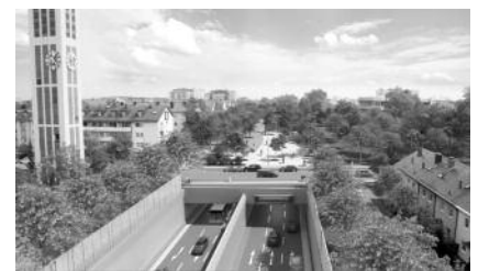
Visualisierung: Tieflage Heckenstallerstraße