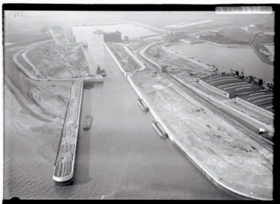
Die nahezu fertiggestellte Nordschleuse zeigt den Vorhafen mit der Westmole und der Ostkaje sowie dahinter die Schleusenkammer. Über dem Binnenhaupt wird noch das Reservetor montiert.