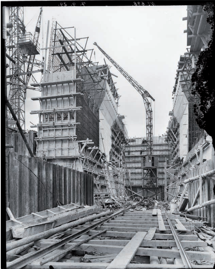
Die aus Stahlbeton hergestellten Torkammern, hier ein Bauzustand am 7. September 1929, sind knapp 20 m hoch.