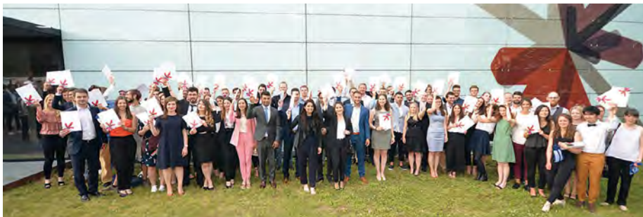
Absolventinnen und Absolventen des Fachbereichs Architektur und Bauingenieurwesen der Hochschule RheinMain

Rund 75 Absolventinnen und Absolventen des Fachbereichs Architektur und Bauingenieurwesen der Hochschule RheinMain nahmen Ende Mai 2018 in feierlichem Rahmen ihre Bachelor- bzw. Masterurkunden entgegen. Unter den Gratulanten war auch die Ingenieurkammer Hessen (IngKH), denn Kammer und Hochschule verbindet seit Jahren eine enge Zusammenarbeit bei der Förderung und Unterstützung junger Menschen im Bereich