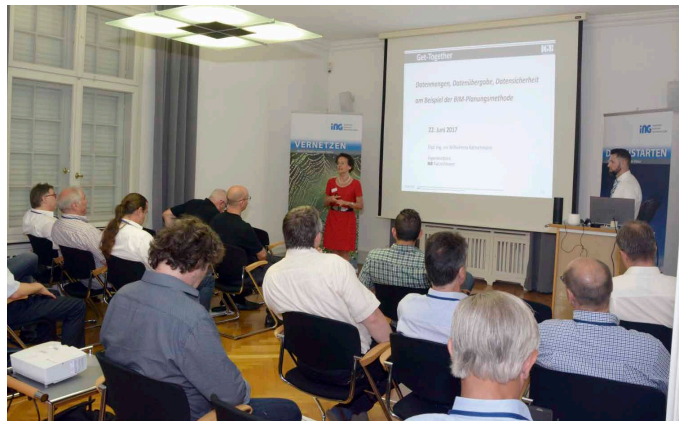
Auch die BIM-Planungsmethode war Thema der Veranstaltung.

Das Thema Digitalisierung beschäftigt uns heute mehr denn je. Es ist nichts Außergewöhnliches mehr, die Wohnung von einem Roboter saugen zu lassen, sich entspannt mit Siri oder Alexa zu unterhalten oder mit Amazon Business eine völlig neue Ära der