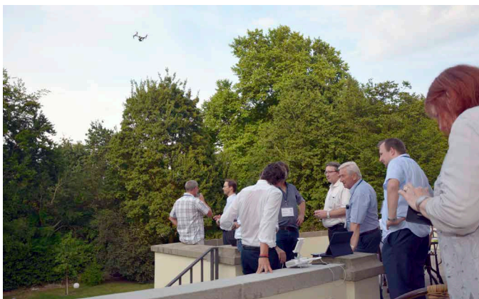
Überraschungsbesuch einer Drohne

Im Anschluss an sechs spannende Vorträge flog als Überraschung eine Drohne heran, die vom Rauminneren und den Gästen Bilder auf den Bildschirm warf. Drohnen bieten auf Baustellen enormen Mehrwert, Effektivität und Arbeitserleichterung, können aber