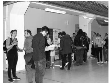
Studenten kamen mit den Vertretern der Ingenieurbüros ins Gespräch.

Die Vorteile für alle Beteiligten liegen auf der Hand: Zum einen binden die Unterneh-