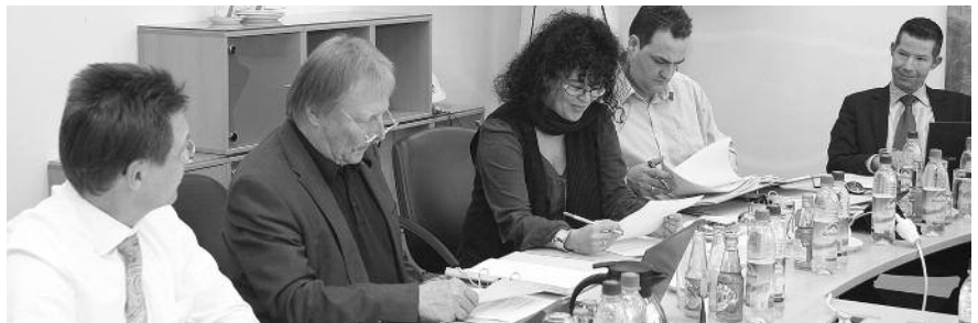
Vorstandsmitglieder und Mitarbeiter bei der Sitzung

Auch 2014 engagiert sich die Kammer in der Aktionsgemeinschaft „Impulse pro Kanalbau“. Mit Informationsveranstaltungen und Pressearbeit kämpft das Bündnis gegen den bestehenden