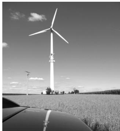
Windräder sind besonders leistungsfähig.

Beide Anlagenarten sind jedoch volatil: Windräder können nur Strom produzieren, wenn der Wind bläst, und die Photovoltaikanlagen können nur Strom produzieren, wenn die Sonne scheint.