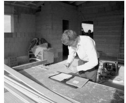
Suchen auch Sie neue Mitarbeiter für Ihr Büro?