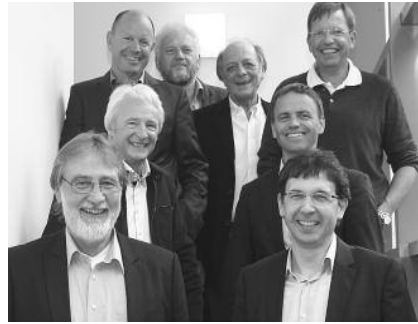
AS Öffentlichkeitsarbeit

Innerhalb des Referates Presse- und Öffentlichkeitsarbeit erfolgt die Bearbeitung von Presseanfragen und die Ausarbeitung von Pressemitteilungen in der Regel am Einzelfall, wobei Vor-