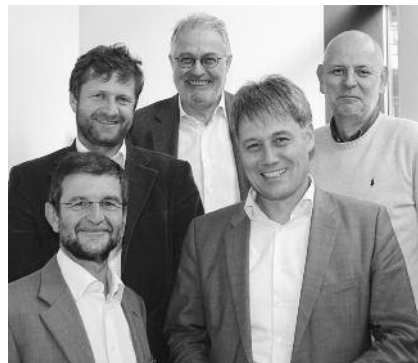
Einige Mitglieder des Arbeitskreises

Einen nächsten Schritt sieht der Arbeitskreis in direkten Gesprächen mit Ingenieuren aus den einzelnen Ländern. In der letzten Sitzung wurde ein Konzept entwickelt, um sich mit Kollegen aus Deutschland, Österreich und