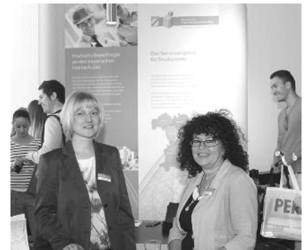
Der Stand der Kammer am VHK-Forum im letzten Jahr.