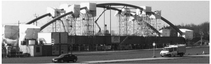
Teilbauwerk Ost, Stahlstabbogenbrücke

Auftragnehmer ist die ARGE EÜ Erlangen – Eltersdorf bestehend aus den Firmen Echterhoff Bau GmbH und SAM Stahlturn und Apparatebau Magdeburg GmbH. Ab dem Fahrplanwechsel 2017 soll im Projekt VDE 8 ( www.vde8.de ) die Fahrzeit mit dem