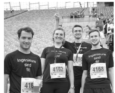
Einige Kammerläufer aus dem vergangenen Jahr.