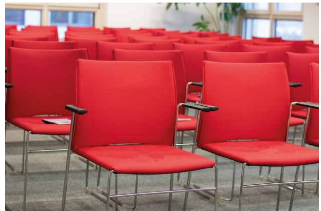
Veranstaltungsraum der BBIK

>> HIER KÖNNEN SIE SICH DAS GESETZ- UND VERORDNUNGSBLATT FÜR DAS LAND BRANDENBURG (GVBL) DOWNLOADEN