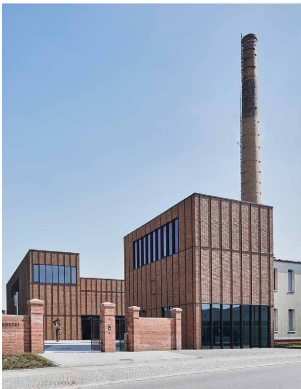
Eingang zur Kulturweberei in Finsterwalde