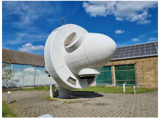
Ausstellung im Freigelände

Tauchen Sie ein in eine Welt der Inspiration im Kulturzentrum Rathenow! Anlässlich des Tages der Baukultur lädt das Kulturzentrum herzlich ein, die Konzeptausstellung "Welten verbinden - Reisen durch Träume und Realitäten" zu besuchen. Genießen Sie ein vielfältiges Programm aus Konzerten, Vorträgen und Happenings, das Kultur, Baukultur und Musik miteinander verschmelzen lässt.