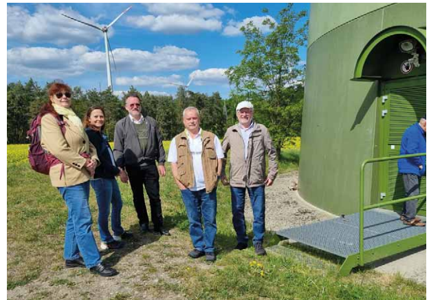
Teilnehmende an einer Windenergieanlage

>> HIER GEHT ES ZU DEN WEITEREN TERMINEN DER REIHE "BAUKULTUR VOR ORT"