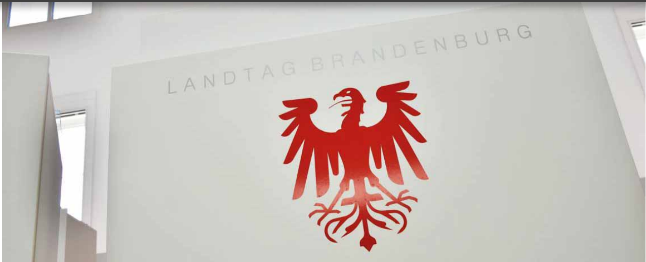
Rednerpult im Plenarsaal des Landtages