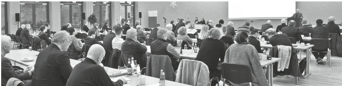
Die Kammerversammlung bietet jährlich Rückblick und Ausblick | AIK S-H

Rund 45 Kammermitglieder folgten der Einladung ins Holstenhallen Congress Center in Neumünster