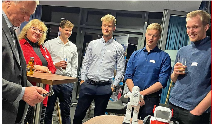
Mini-Roboter begeisterten in der Pause.