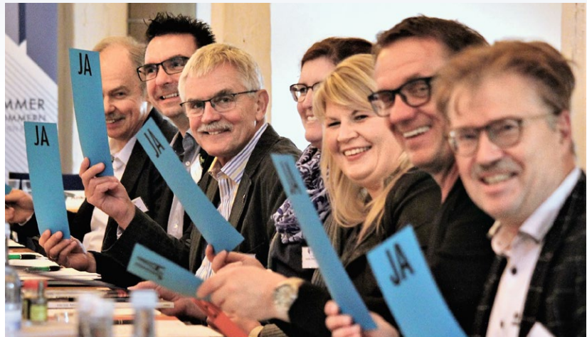
Einstimmig: Die Ingenieurkammer M-V wird Mitglied des Vereins Initiative Baukultur in Mecklenburg-Vorpommern.

Die Digitalisierung der Geschäftsstelle, die in der Umsetzung nach außen dem Onlinezugangsgesetz (OZG)