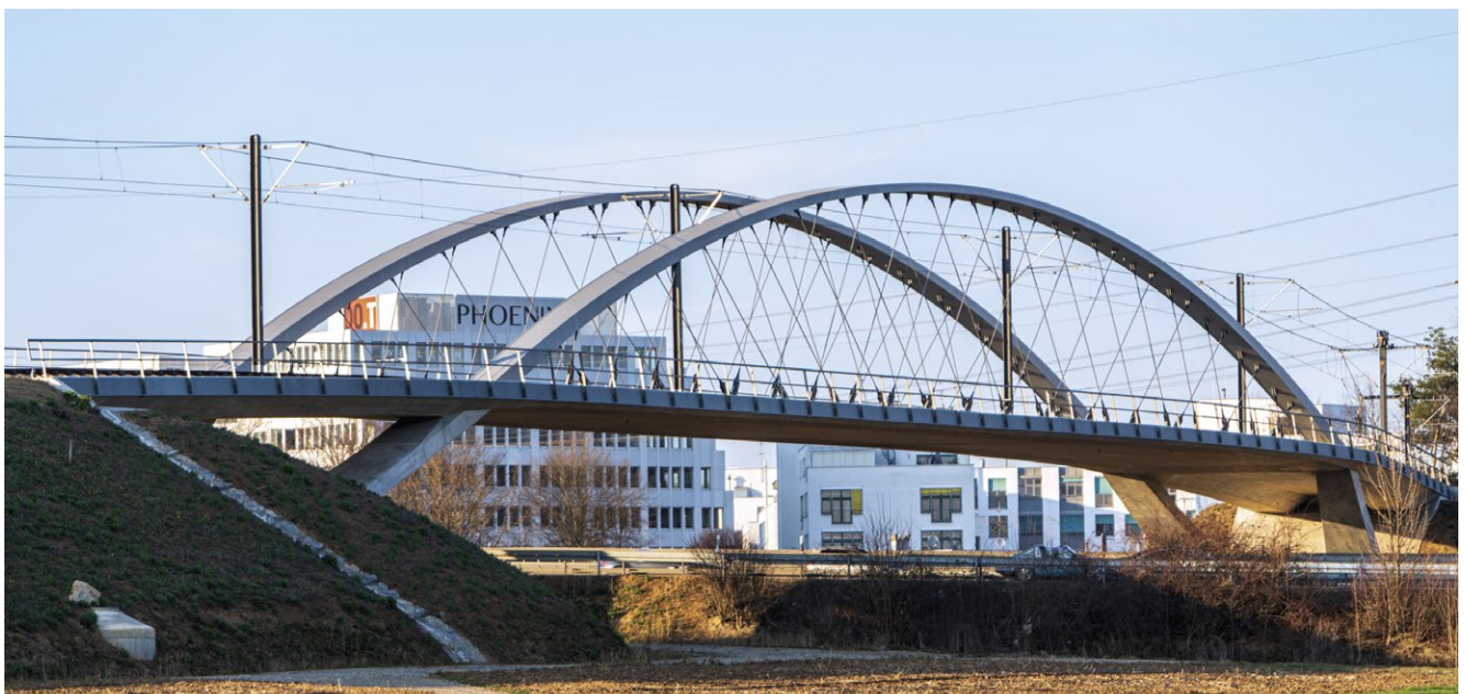
Achtzig Meter weit überspannt die Stadtbahnbrücke die A8 an der Anschlussstelle Stuttgart-Degerloch

Außerdem wurden drei Auszeichnungen mit jeweils 5.000 Euro Preisgeld sowie eine Anerkennung mit je 3.000 Euro vergeben.