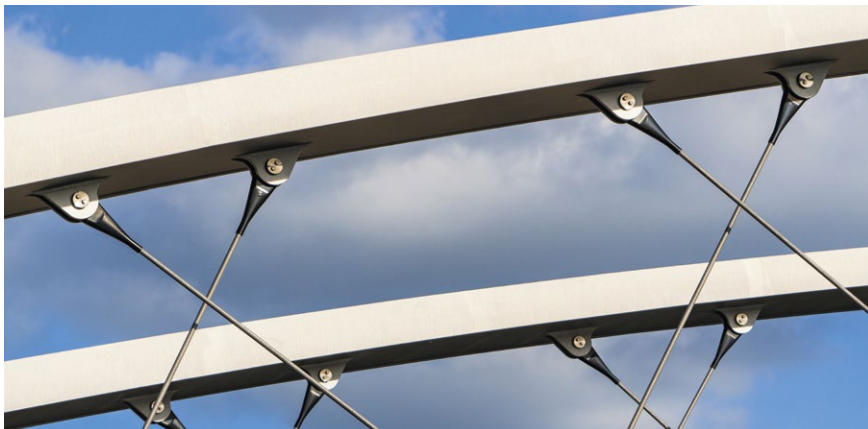
Eine Innovation sind die geeigneten, sich kreuzenden Hängerseile aus Carbon-Zugselementen

Der Deutsche Ingenieurbaupreis wurde bereits zum vierten Mal in gemeinsamer Trägerschaft des Bundesministeriums für Wohnen, Stadtentwicklung und Bauwesen und der Bundesingenieurkammer auslobt. Der Preis wird im Zweijahres-