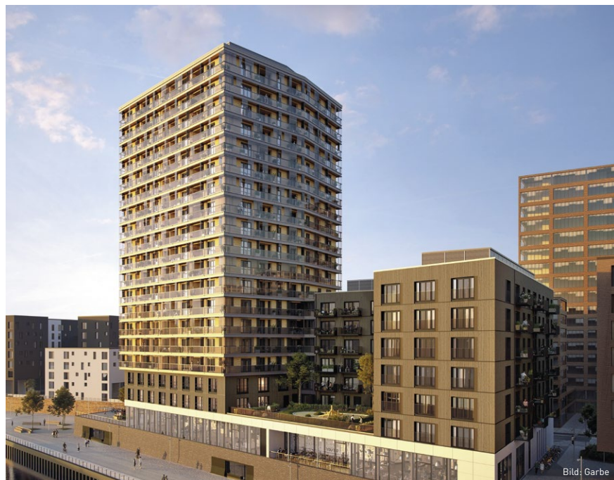
So soll es einmal aussehen: Das Holzhochhaus Roots in der Hafencity in Hamburg.