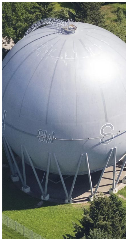
Die Zukunft der Gaskugel unter Denkmalschutz bleibt offen

Mehr Informationen unter: → www.gaskugel-freiburg.de