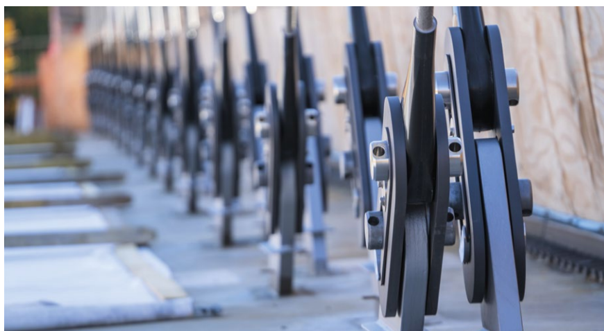
Carbon ist leichter und langlebiger als herkömmlicher Stahl

Projekt: Lady-Herkomer-Steg, Landsberg am Lech