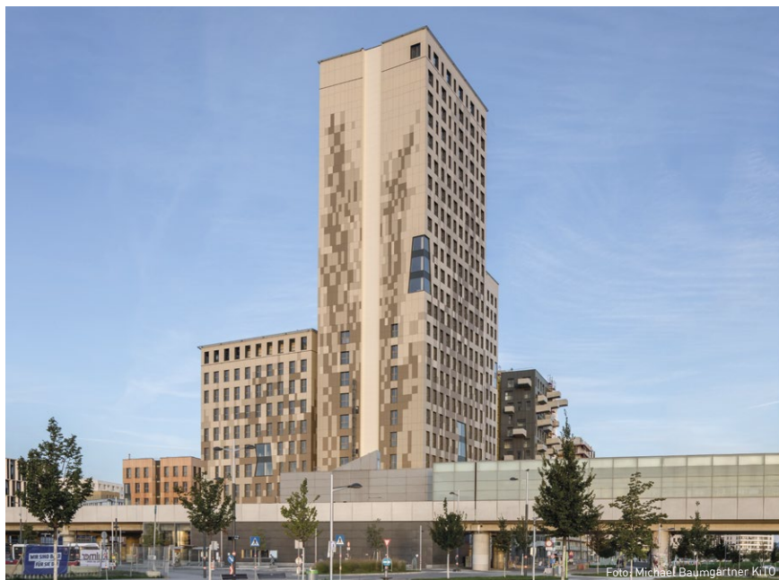
Das HoHo Wien ist mit 84 Metern Höhe das zweithöchste Holzhochhaus der Welt.