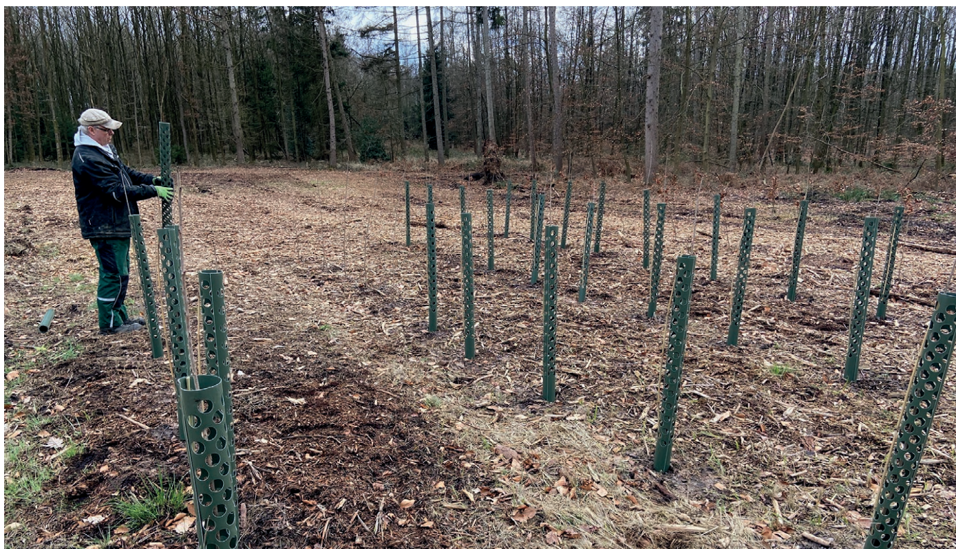
Ein Mitarbeiter des Forstbetriebs Linnep/Ratingen versieht die gepflanzten Vogelkirschen mit einem Verbiss- und Fegeschutz.