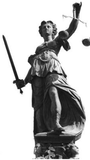
Kammer prüft ausländische Abschlüsse.

Damit für die Frage, woran sich die Ausbildungsnachweise messen lassen müssen, eine praktikable Antwort gefunden werden kann, gibt es erstmals im Ingenieurgesetz eine Definition für