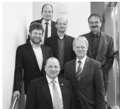
Die Väter des Traineeprogramms.

Seitens der Teilnehmer und ihrer Arbeitgeber gab es sehr viel positives Feedback, so dass inzwischen klar ist, dass das Traineeprogramm fester Bestandteil des Weiterbildungsangebotes