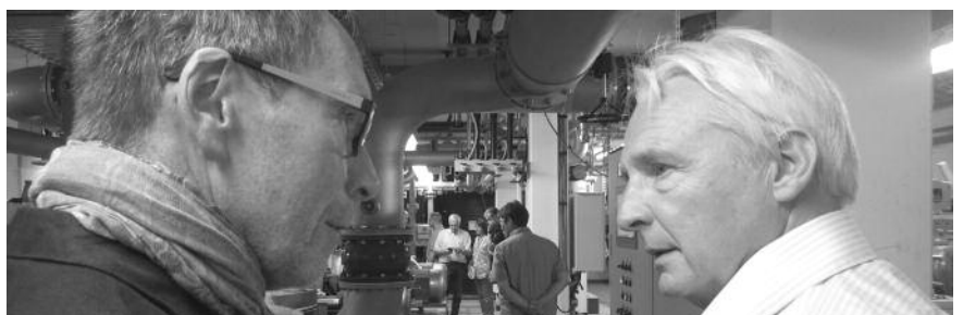
Besichtigung der Wasseraufbereitungsanlage auf dem Betriebsgelände der WWV Würzburg