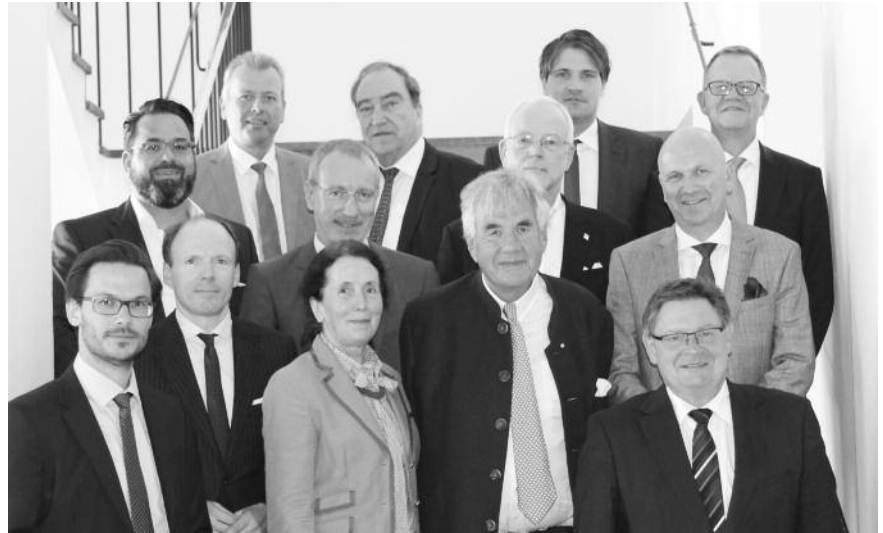
Kammer-Vizepräsident Prof. Gebbeken nahm am Spitzengespräch bei Staatssekretär Gerhard Eck teil.

Das Expertengremium diskutierte u.a. die Einführung einer Typengenehmigung, wie es sie derzeit in Hamburg und Nordrhein-Westfalen gibt. Eine nennenswerte Verfahrensbeschleunigung verspricht dieses Vorgehen jedoch aus Sicht der Teilnehmer nicht. Auch durch eine Genehmigungsfiktion oder eine Lockerung des Schall-