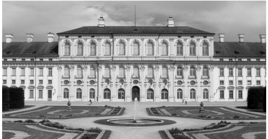
Der Festakt findet im Schloss Schleißheim statt.

Die Jury hat alle Einreichungen intensiv geprüft und ist zu einem Urteil gekommen. Welche Bauwerke dieses Jahr den Preis erhalten und ob sie mit Gold, Silber oder Bronze ausgezeichnet